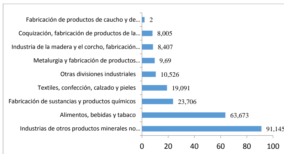
Gráfico 2. Inversión en protección y conservación del ambiente por grupos de divisiones Industriales (millones de pesos)

Fuente: Dane, encuesta ambiental industrial (EAI) 2016. Cifras en millones de pesos